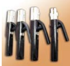
Электрододержатель DE, от 200 до 500А