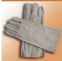
краги из спилка