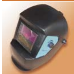
маска сварочная Focus