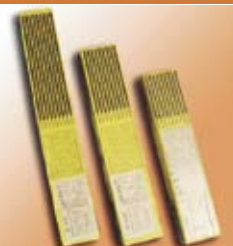
электрод сварочный ОК-46.00 3мм.