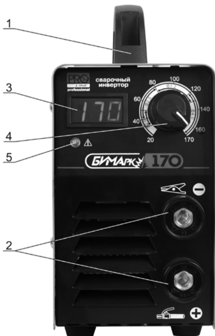
Рисунок 2 – Лицевая панель выпрямителя сварочного БИМАРК-170

Точная величина сварочного тока выбирается путём проведения пробных сварок на аналогичных образцах.