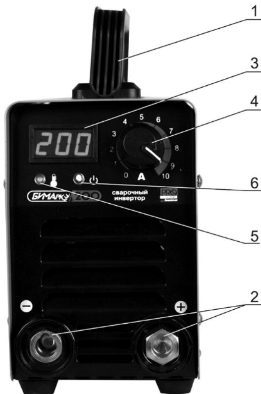
Рисунок 2 – Лицевая панель выпрямителя сварочного БИМАрк-200 PRO Line