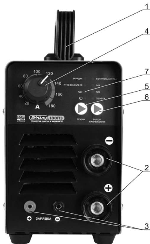
Рисунок 2 – Лицевая панель выпрямителя БИМАrc-180P3 PRO Line

Точная величина сварочного тока выбирается путём проведения пробных сварок на аналогичных образцах.