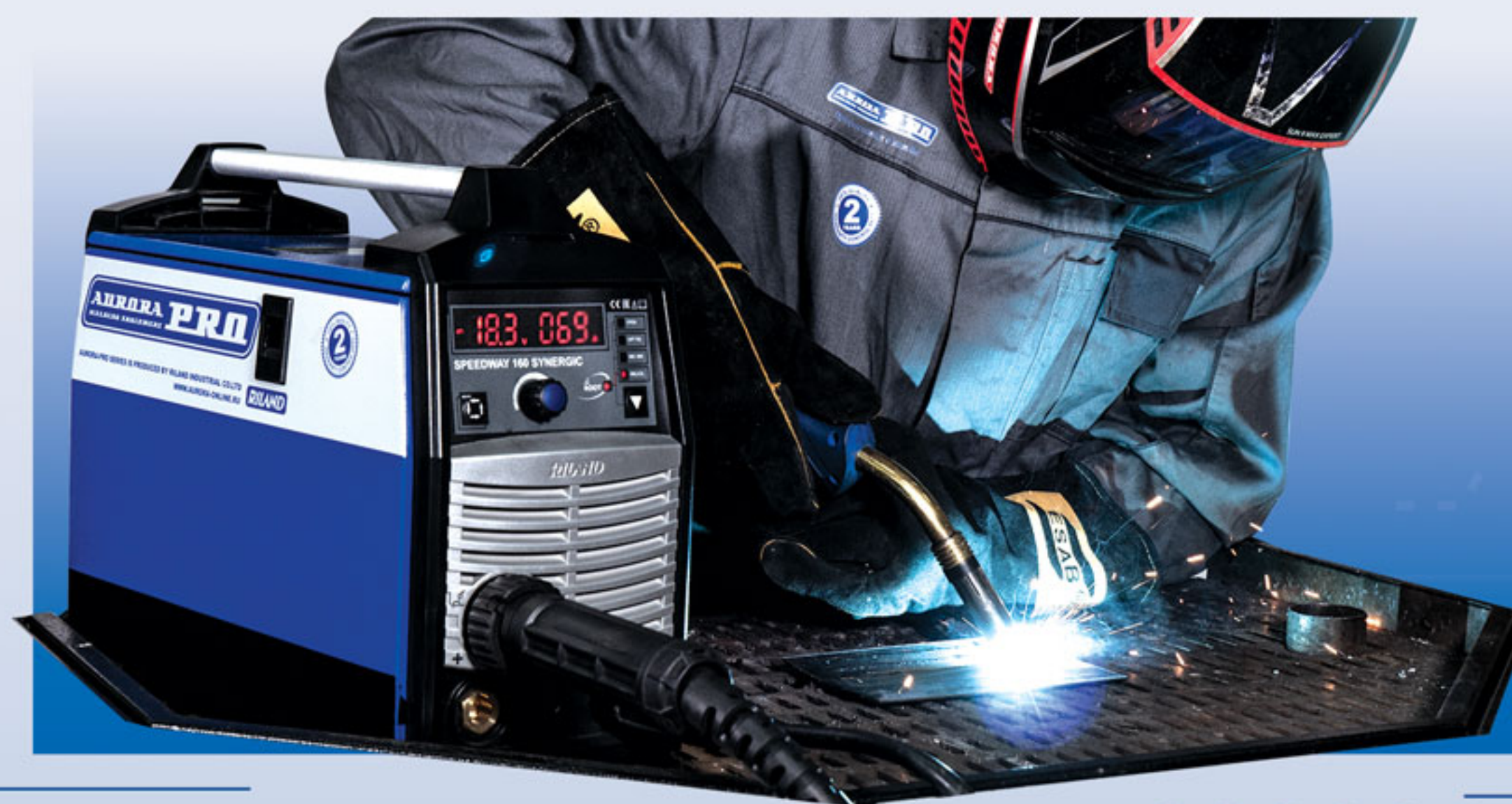
Сварка в режиме ROOT

Процесс ROOT снижает число брызг на 30-50 % при сварке в обычной углекислоте CO2, что позволяет экономить на дорогих газовых смесях, а также избежать затрат на последующую обработку около шовных зон. Специальный характер переноса электродного металла в новом режиме позволяет сварщику, даже с небольшим опытом справляться со сложными задачами. Особо точный контроль тепловложения позволяет сваривать тонколистовой металл и сваривать детали с большими зазорами.