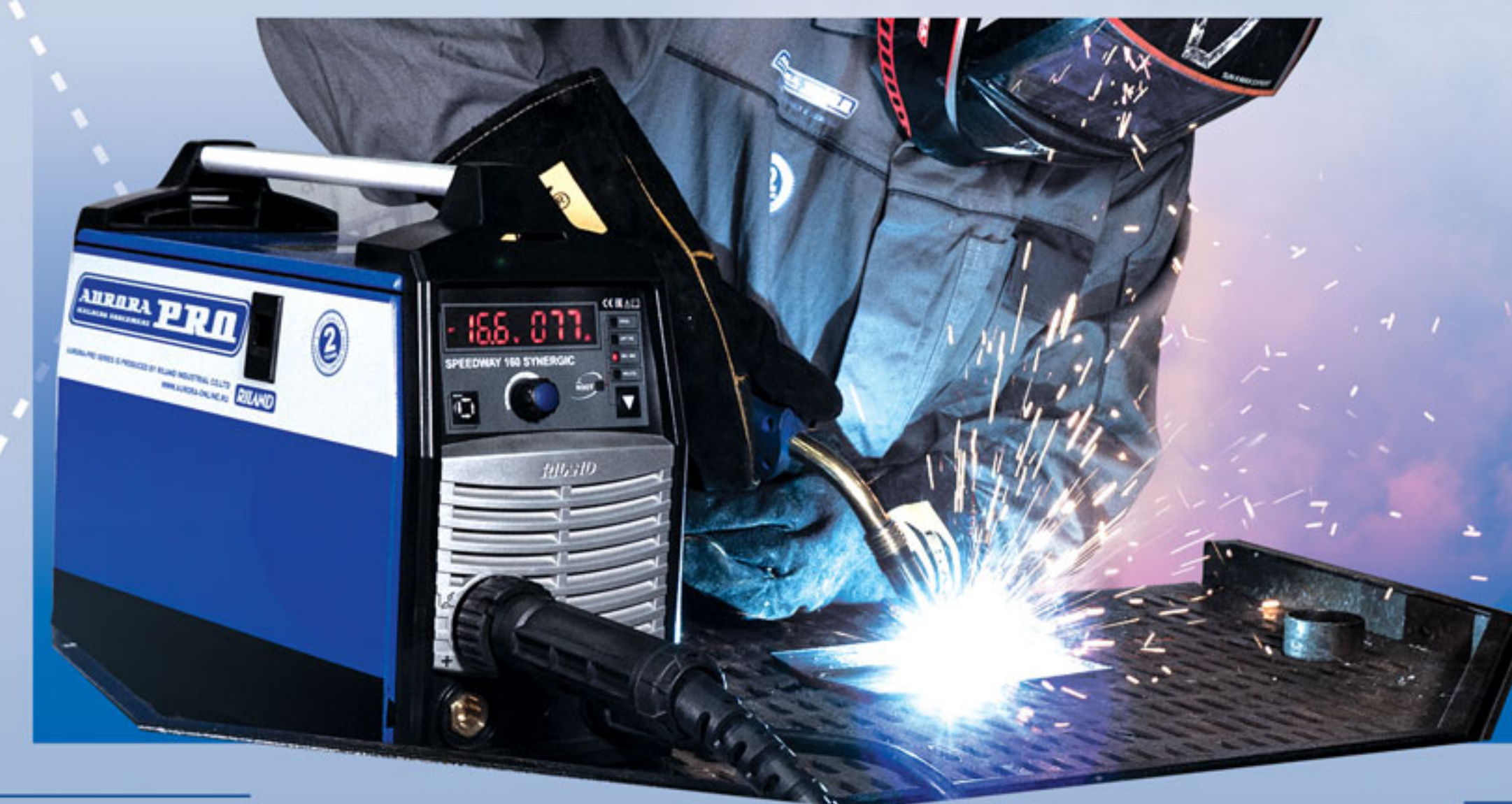
Сварка без режима ROOT

Аппарат может применяться для сварки следующих металлов: • Сталь • Нержавейка • Алюминий