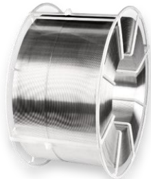
Кассета K 400

Размеры: наружный диаметр 400 мм внутренний диаметр 190 мм ширина 200 мм вес наматываемой проволоки 40 кг диаметры проволоки 1,2-1,6-2,4 мм