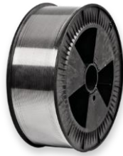
Кассета D 300

Размеры: наружный диаметр 300 мм внутренний диаметр 52 мм ширина 100 мм вес наматываемой проволоки 6 кг диаметры проволоки 0,8-1,0-1,2-1,6-2,4 мм