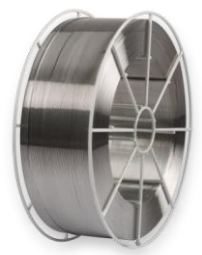
Кассета BS 300

Размеры: наружный диаметр 300 мм внутренний диаметр 52 мм ширина 98 мм вес наматываемой проволоки 7 кг диаметры проволоки 0,8-1,0-1,2-1,6-2,4 мм