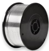
Кассета D 100

Размеры: наружный диаметр 100 мм внутренний диаметр 16 мм ширина 42 мм вес наматываемой проволоки 0,5 кг диаметры проволоки 0,8-1,0-1,2-1,6 мм