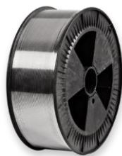
Кассета D 300

Размеры: наружный диаметр 300 мм внутренний диаметр 52 мм ширина 100 мм вес наматываемой проволоки 6 кг диаметры проволоки 0,8-1,0-1,2-1,6-2,4 мм