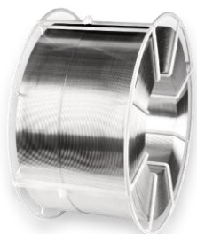
Кассета K 400

Размеры: наружный диаметр 400 мм внутренний диаметр 190 мм ширина 200 мм вес наматываемой проволоки 40 кг диаметры проволоки 1,2-1,6-2,4 мм