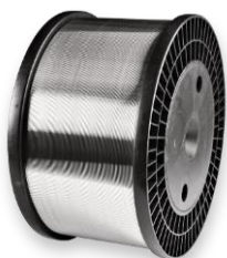
Кассета K 350

Размеры: наружный диаметр 350 мм внутренний диаметр 52 мм ширина 158 мм вес наматываемой проволоки 20 кг диаметры проволоки 1,2-1,6-2,4 мм