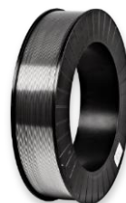
Кассета SH 460

Размеры: наружный диаметр 460 мм внутренний диаметр 319 мм ширина 91 мм вес наматываемой проволоки 18 кг диаметры проволоки 1,2-1,6-2,0-2,4-3,2 мм