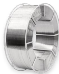
Кассета K 300

Размеры: наружный диаметр 300 мм внутренний диаметр 190 мм ширина 98 мм вес наматываемой проволоки 7 кг диаметры проволоки 0,8-1,0-1,2-1,6-2,4 мм