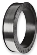
Кассета SH 390 K

Размеры: наружный диаметр 390 мм внутренний диаметр 310 мм ширина 79 мм вес наматываемой проволоки 7 кг диаметры проволоки 1,2-1,6-2,0-2,4-3,2 мм