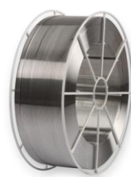
Кассета BS 300

Размеры: наружный диаметр 300 мм внутренний диаметр 52 мм ширина 98 мм вес наматываемой проволоки 7 кг диаметры проволоки 0,8-1,0-1,2-1,6-2,4 мм